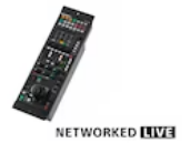
RCP-3500 Fernsteuerpult für Kameras der Serien HDC/HSC/HXC