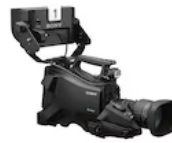
HXC-FB80 HD-Farb-Studiokamera mit drei 2/3" Exmor™-CMOS-Sensoren