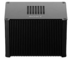
Edge Analytics Appliance

Handwriting Extraction PTZ Auto Tracking Chromakey-less CG Overlay