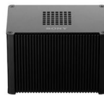
Edge Analytics Appliance

Handwriting Extraction PTZ Auto Tracking Chromakey-less CG Overlay